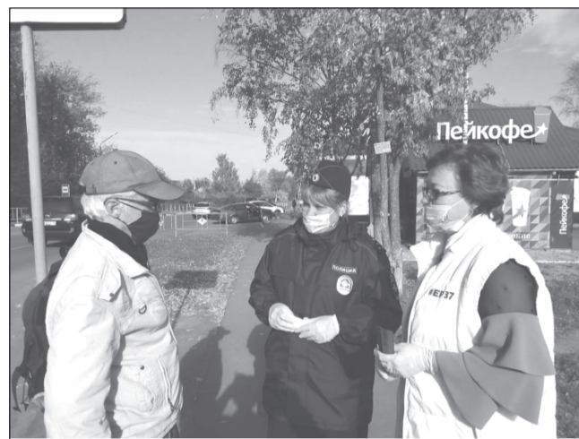
Соблюдайте правила дорожного движения

Специально для данного мероприятия сотрудники подготовили памятки-листовки, которые вручали пешеходам преклонного возраста. Также в рамках проводимого мероприятия сотрудники ГИБДД обращали внимание водителей на необходимость проявления повышенной осторожности и осмотрительности в отношении пожилых пешеходов, которые в силу своих возрастных