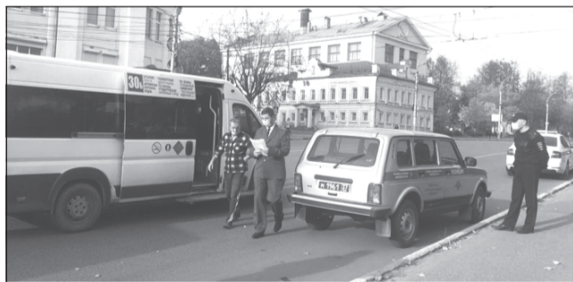
Послаблений для нарушителей антиковидного режима не будет

В Иванове в усиленном режиме продолжены проверки общественного транспорта на предмет соблюдения регламентов профилактики коронавирусной инфекции. Очередные рейды сотрудники регионального департамента дорожного хозяйства и транспорта, Роспотребнадзора и полиции провели на улице Куковской и Шереметевском проспекте.