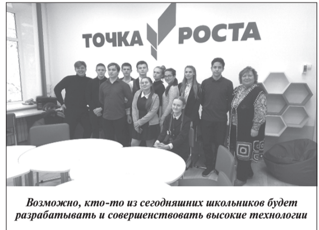
Возможно, кто-то из сегодняшних школьников будет разрабатывать и совершенствовать высокие технологии

По результатам обсуждения и игры учитель подвёл обучающихся к выводу о том, что для решения такой непростой задачи как беспи-