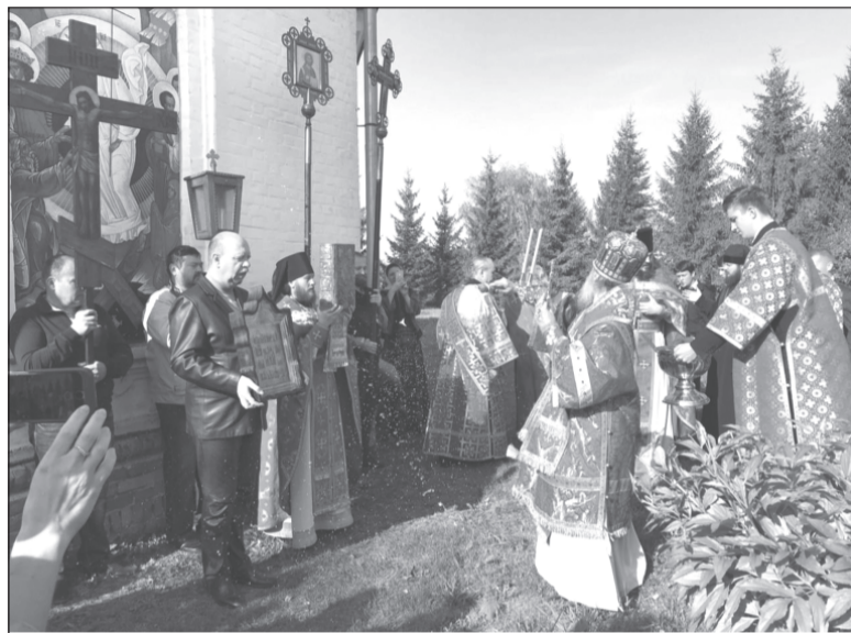
В наше время, как и всегда, в храме регулярно совершаются богослужения