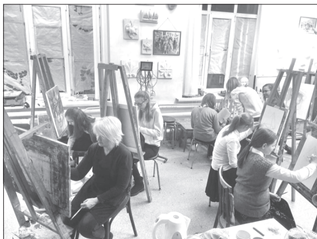
Юные художники в творческой мастерской