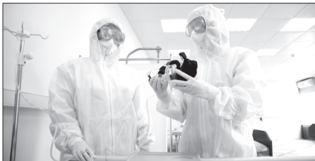
За последние сутки статистика летальности пополнилась 3 случаями

Напомним, в соответствии с указом губернатора в регионе усилена работа