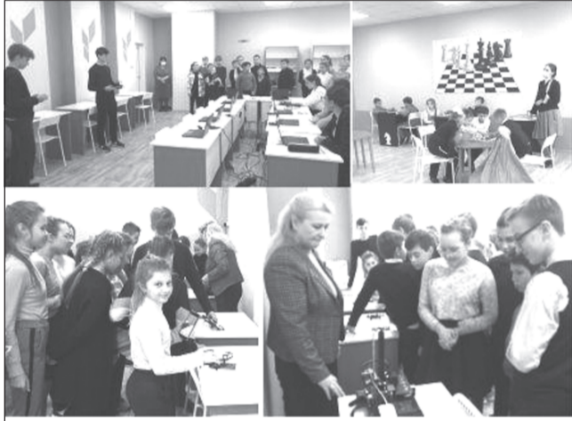
В марафоне открытий приняли участие две школы г. Приволжска (СШ №1 и СШ №6), в которых с этого учебного года начали функционировать центры образования

В регионах России прошел марафон открытий федеральной сети Центров образования гуманитарного и цифрового профилей «Точка роста», оборудованных на базе школ. В Ивановской области в этот день свои двери для учащихся открыли десять образовательных центров. Напомним, еще 28 центров, созданных в регионе в этом году, открылись ранее.