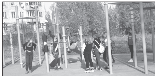
Новая детская площадка — комфортно, функционально, красиво