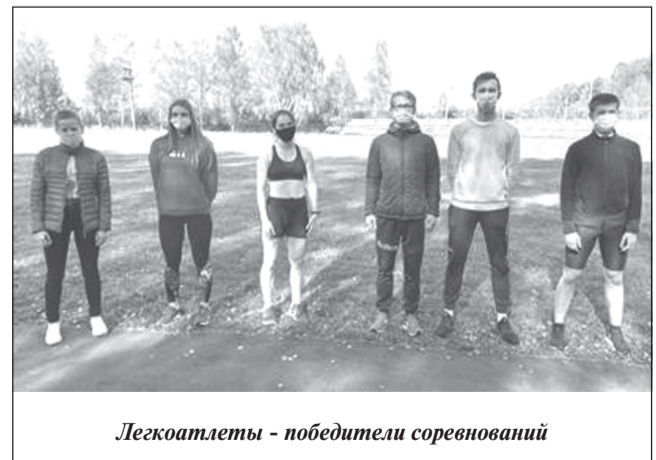
Легкоатлеты - победители соревнований