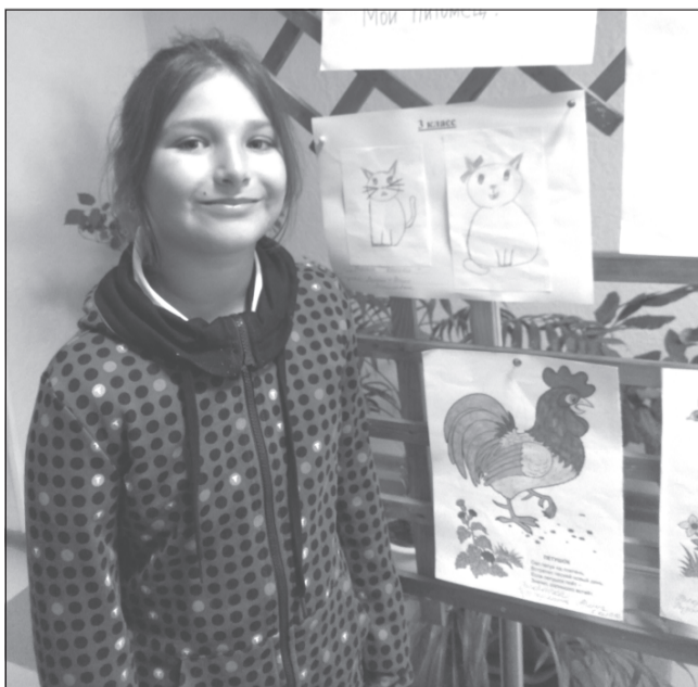
Обучающиеся приняли активное участие в конкурсе рисунков

4 октября во всем мире отмечался День защиты животных, который призван воспитать у взрослых и детей чувство ответственности за все живое на планете, словом и делом помочь животным, нуждающимся в нашей поддержке и помощи, объединить усилия в защите прав домашних животных.