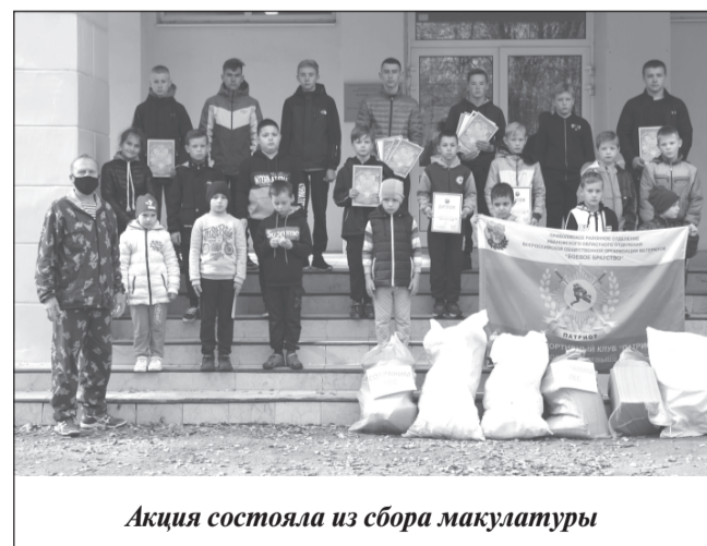
Акция состояла из сбора макуллатуры